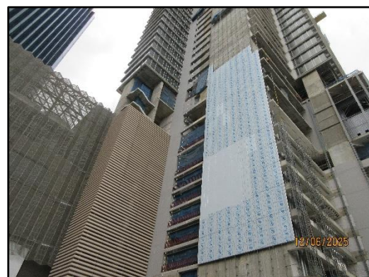
รูปที่ 1-2 สภาพปัจจุบันของพื้นที่โครงการ