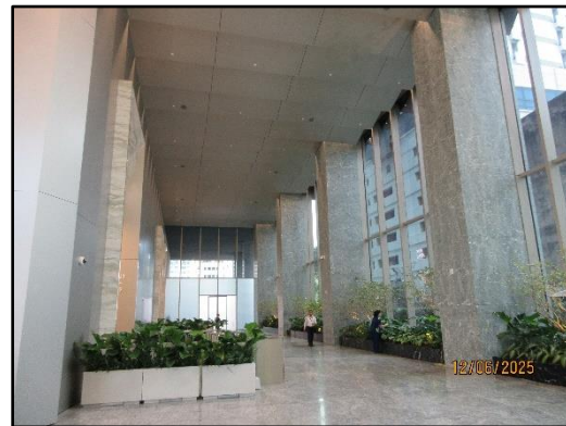
รูปที่ 1-2 สภาพปัจจุบันของพื้นที่โครงการ